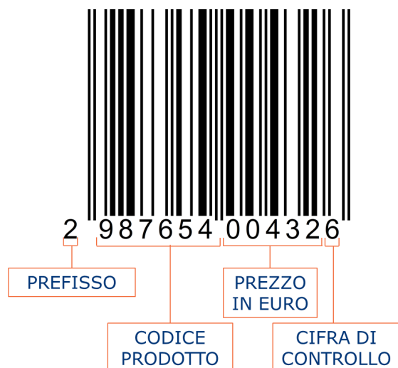
Esempio Codice prodotto a Peso Variabile

Con questo termine si definiscono i prodotti per i quali la confezione non ha un peso predeterminato e costante ed il cui prezzo di vendita unitario varia quindi in funzione del peso. Per questi prodotti GS1 Italy mette a disposizione una particolare struttura di codifica che permette di rappresentare in codice a barre oltre al codice prodotto anche il prezzo unitario.