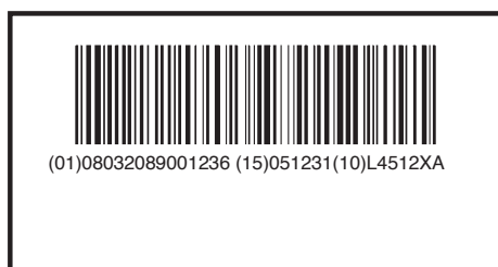
Esempio 1: codifica GS1-128