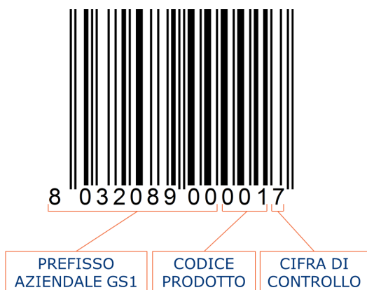
esempio di composizione del GTIN-13

La scelta della struttura numerica da utilizzare dipende dalla natura dell'articolo e dell'ambito di applicazione.