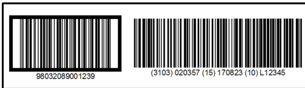
Esempio 2: Codifica composta ITF-14 + GS1-128

Unità pezzo a Peso Variabile, prodotti per i quali non è previsto il passaggio in vendita diretta al consumatore finale)