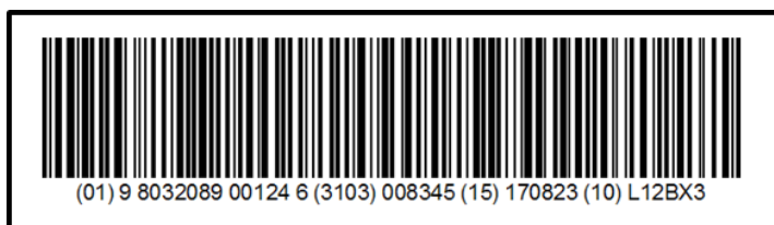
Esempio: Codifica GS1-128