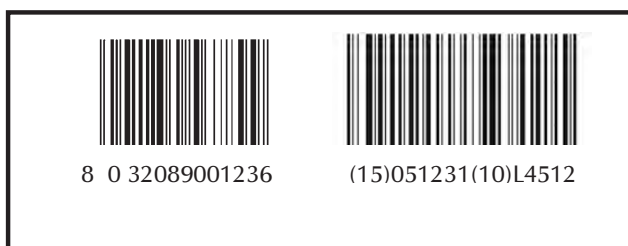
Esempio 2: codifica EAN/UCC-13 e GS1-128